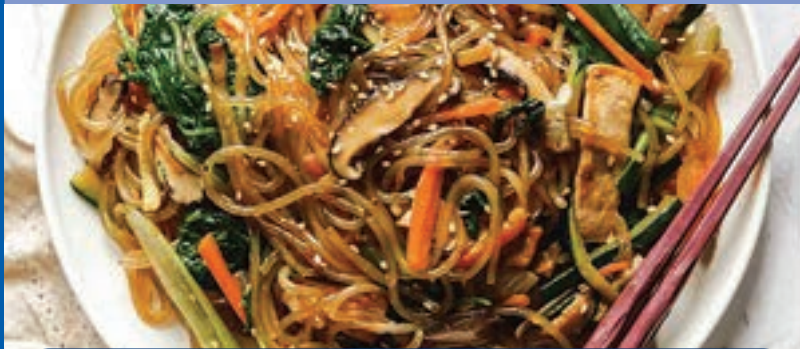
Japchae yog ib hom fawm kib Kaus Lim uas nrov npe heev muab cov fawm siv qos yaj ywm qab zib los ua, zaub thiab nceb.